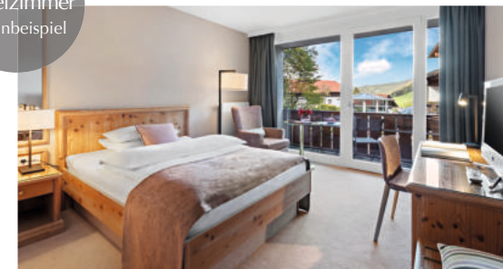
Classic Einzelzimmer Wohnbeispiel

Unsere Zimmerpreise gelten pro Zimmer und Nacht inklusive dem Allgäu-Sonne-Frühstücksbuffet sowie allen Inklusivleistungen.