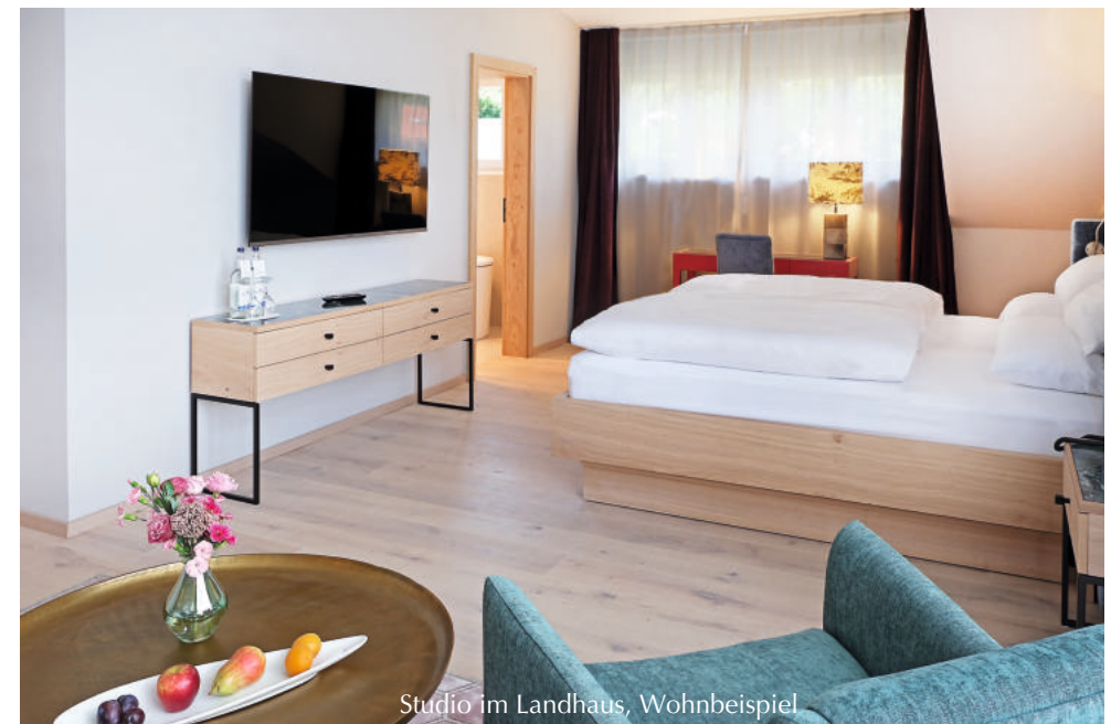
Studio im Landhaus, Wohnbeispiel