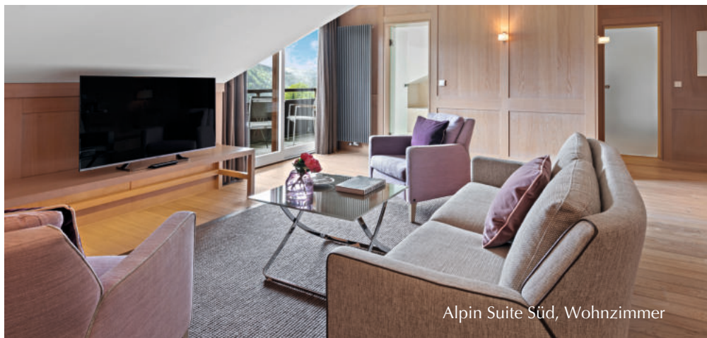
Alpin Suite Süd, Wohnzimmer