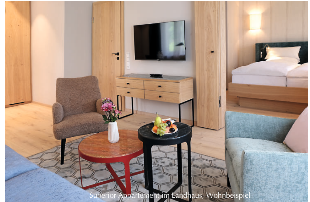
Superior Appartement im Landhaus, Wohnbeispiel