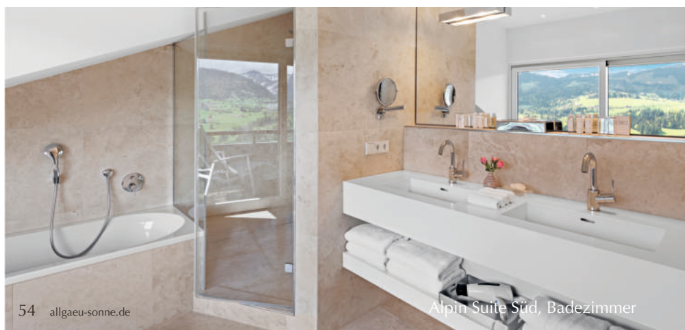
Alpin Suite Süd, Badezimmer