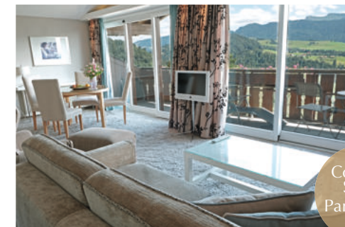
Comfort Suite Panorama