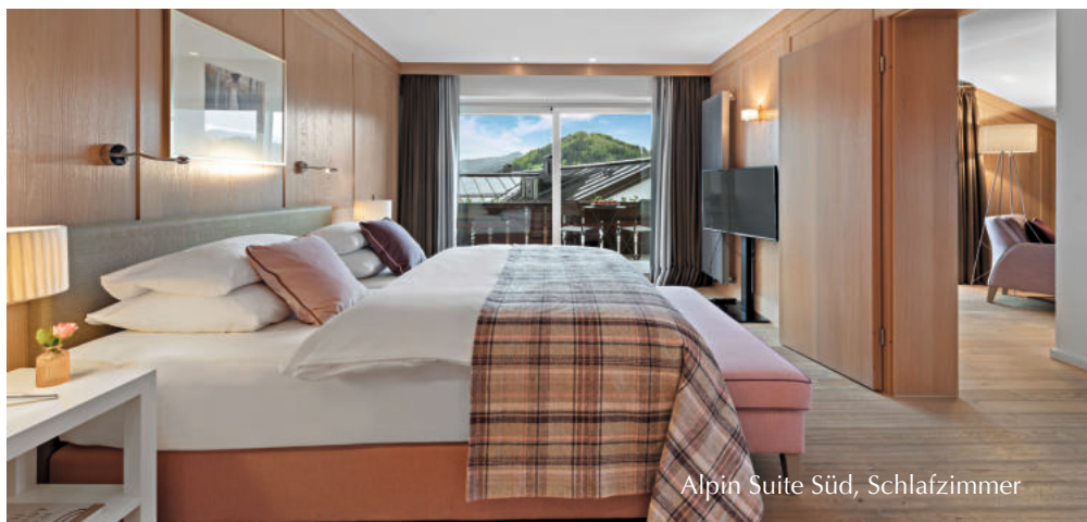
Alpin Suite Süd, Schlafzimmer