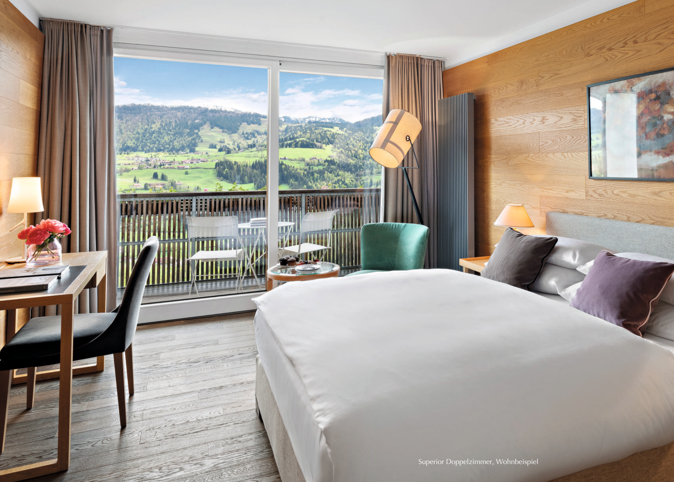
Superior Doppelzimmer, Wohnbeispiel