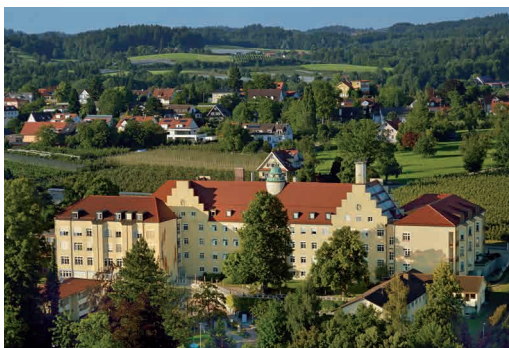
Asklepios Klinik Lindau

Ich operiere seit 20 Jahren bei erstmaligem Hüftgelenkersatz ausschließlich mit dieser Technik und habe über 4.500 Patienten mit dieser schonenden Operationsmethode behandelt.