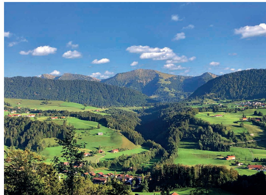
Ausblick vom Hotel Allgäu Sonne auf Hochgrat und Nagelfluhkette.

Diese Broschüre ist gültig ab November 2023 und verliert mit Erscheinen einer neuen Broschüre ihre Gültigkeit. Änderungen vorbehalten.